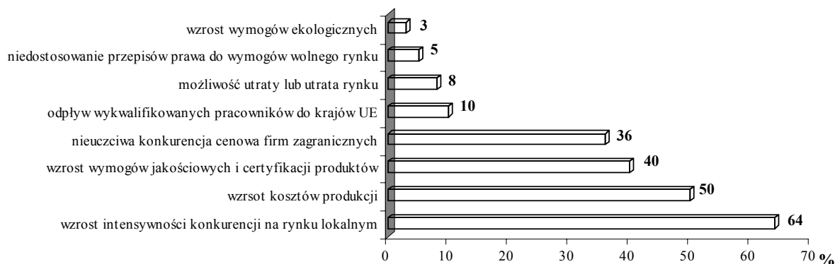
Wykres 3. Zagrożenia dla sektora MSP związane z integracją europejską

Najczęściej identyfikowanym przez przedsiębiorców zagrożeniem jest wzrost intensywności konkurencji w następstwie procesów integracyjnych, który traktować można jako oczywistą konstatację. Wskazać warto, iż takie zagrożenie identyfikowane jest aż przez 64% badanych przedsiębiorstw. Z drugiej strony oznacza to, że ponad jedna trzecia badanych przedsiębiorstw nie traktuje wzrostu intensywności konkurencji jako zagrożenia. Jest to dobry sygnał wskazujący, iż ta znaczna grupa przedsiębiorstw ocenia, iż jest zdolna sprostać nowym wyzwaniom konkurencyjnym.